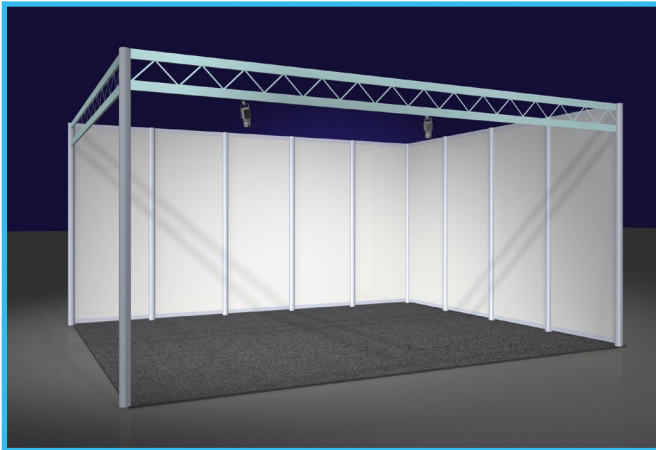
STAND PLUS je m 2 /per sq.m. € 50,00 (Mindestgröße 6 m 2 /Minimum size 6 sq.m.)