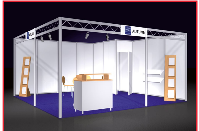
AUTUMN je m 2 /per sq.m. € 95,00 (Mindestgröße 25 m 2 /Minimum size 25 sq.m.)