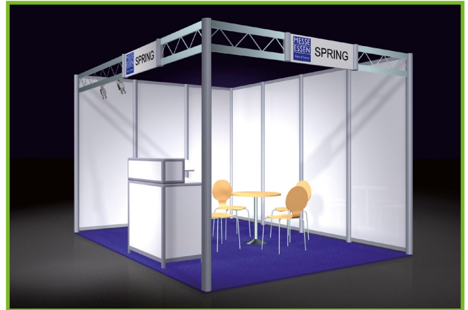
SPRING je m 2 /per sq.m. € 86,00 (Mindestgröße 6 m 2 /Minimum size 6 sq.m.)